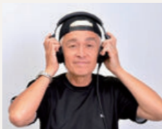
マーク・パンサー globe

大分県出身のお笑い芸人。ダイノジとして1994年にコンビを結成し、現在ではマルチに活躍の場を広げている。