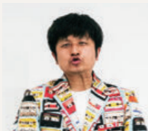
ダイノジ(大谷) お笑い芸人

大分県出身のお笑い芸人。ダイノジとして1994年にコンビを結成し、現在ではマルチに活躍の場を広げている。